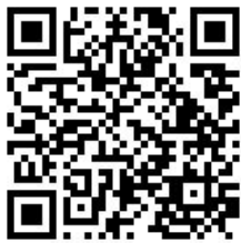
公開展覽相關書件下載

臺中港地區自擘劃「新高港」築港，經歷61年發布實施特定區計畫及65年港區正式竣工通航迄今，臺中港區為掌握雙港前緣之區域，一直肩負中臺灣重要對外貿易門戶，配合市府於本地區陸續推動包括捷運藍線、臺中山海環線、海空雙港計畫、市港合作等政策及相關建設，皆逐步落實國土計畫中「雙港核心中之雙港門戶策略區」的市政願景，帶動海線整體繁榮發展。 因應新的交通系統、新的都市結構政策及環境思維，考量前次通盤檢討係於100年2月至107年9月分階段發布實施。107年至今都市發展背景與時空環境已有所改變，為符合現況發展需要及未來發展趨勢，並落實都市計畫執行及管理，爰依都市計畫法第26條規定辦理通盤檢討作業，期望藉由第四次通盤檢討之規劃執行，核實檢討地區發展人口及建設需求，除針對地區需求及發展辦理用地調整外，為進一步簡化審議程序，同時辦理主細計分離作業，強化地方自治彈性及效能，希冀逐步落實「雙港核心」的市政願景，帶動海線整體繁榮發展，成為兼具陸海空三港便捷運輸的國際化重鎮及高價值、高增值的運籌基地。