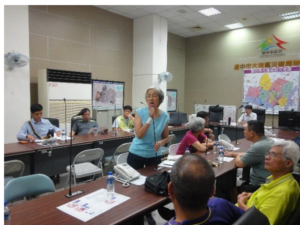
出席土地所有權人意見交流(二)