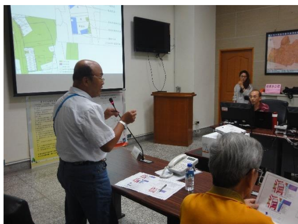
出席土地所有權人意見交流(一)