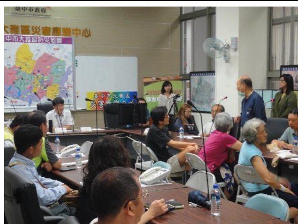
出席土地所有權人意見交流(四)