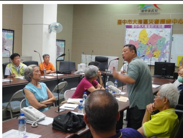
出席土地所有權人意見交流(三)