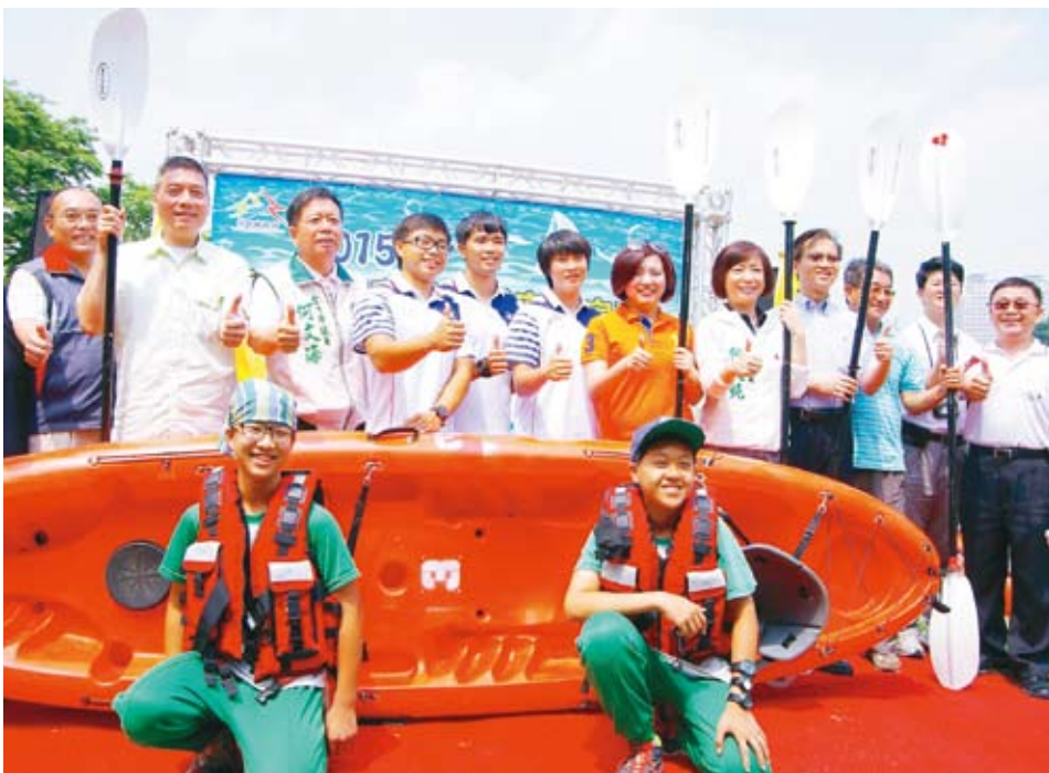
夏季來臨，台中市政府與泳池協會、業者共同推出「學生游泳優惠方案」，鼓勵學童在游泳池內安全戲水。

相關活動，並針對參加學校游泳課程的學生、游泳俱樂部人士等，辦理水域觀摩及實際演練，強化自救能力，而有效減低溺水事件。