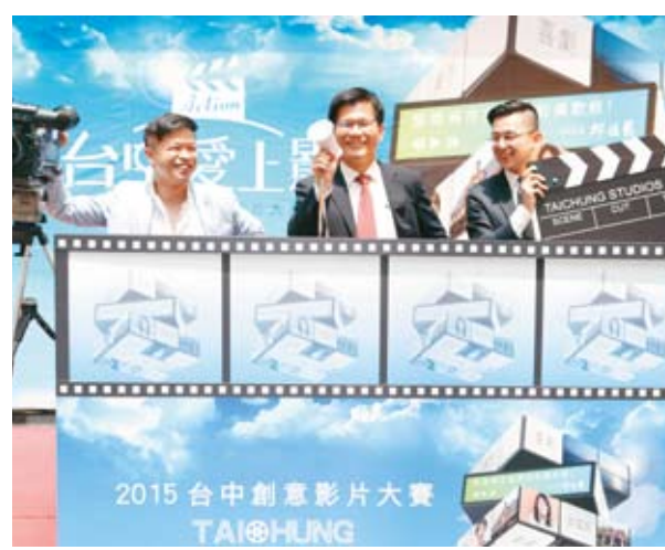
「ACTION! 台中愛上影」邀大家一同來參賽。