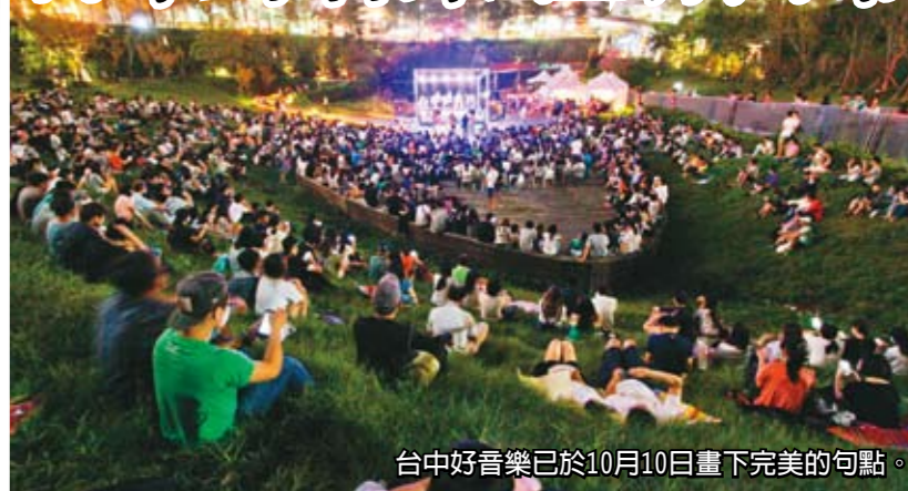
台中好音樂已於10月10日畫下完美的句點。

市府在9月18日至10月10日的週末夜，邀請市民到市政公園、秋紅谷公園和豐原陽明大樓在草地上、星空下享受音樂。「讓台中的每一個角落，都是市民活動的舞台！」一共六場的台中好音樂已於10月10日在豐原陽明大樓畫下完美的句點，現場溫馨又歡樂，也與民衆相約明年再見！