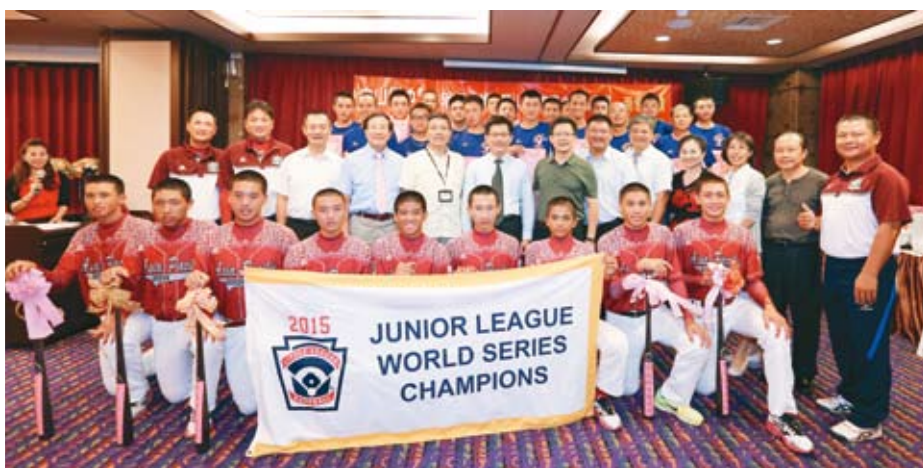
中市中山國中與西苑高中獲得國際賽事佳績，市長林佳龍表揚鼓勵。

「台灣之光、台中之光！」林市長表示，市府也將作爲各位選手最強大的後盾，除在實質上給予支持外，明年度運動設施相關預算編列也增加，要把棒球視爲台中市的重點運動。他也希望未來棒球可朝向社區化方式在各地區及校園展開，提供友善的環境，將運動向下扎根，以利人才培養。