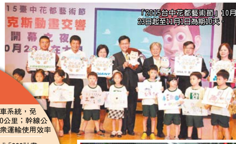
「2015台中花都藝術節」10月23日起至11月1日為期10天。