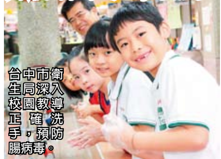
台中市衛生局深入校園教導正確洗手，預防腸病毒。

問：我家有國小學童，還有名三歲幼兒，很擔心小朋友感染腸病毒，請問要如何預防？市政府又有哪些措施因應？