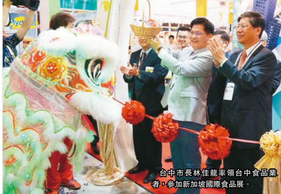
台中市長林佳龍率領台中食品業者，參加新加坡國際食品展。