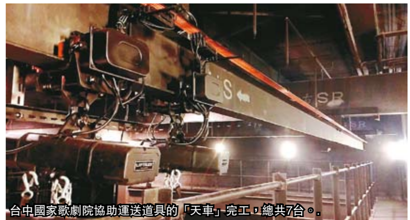
台中國家歌劇院協助運送道具的「天車」完工，總共7台。

台中國家歌劇院啓用最後倒數，大劇院主舞台也即將驗收；協助運送道具的「天車」已經完成，總共7台天車全採德國規格，安全、承重、速度都是國際級標準，升降速度每秒16公分，可依演出需求升降道具，讓演出更具世界專業水準。 台中市政府建設局表示，天車吊勾各設置在歌劇院大、中劇場左右舞台、和3個劇場地下室舞台卸貨區；大劇院左、右舞台各2組、共4台天車，光是單個天車，就可以吊起重達1噸的道具或物品，升降速度為每秒16公分，非常快速，可依照演出需求上下升降物品道具，讓道具配合演出精準到位。 不同於普通的天車，台中國家歌劇院的天車特別加強安全系統，每個鏈條馬達都配置2組煞車，最主要考量舞台上眾多的裝台人員來往行走，萬一發生吊裝物品掉落，恐造成意外傷害，因此歌劇院天車特別設計雙煞車系統，萬一其中一組故障，另組煞車仍可承受全部吊掛物品的重量。 另外天車在3條軌道、4台電動小車的輔助下，鏈條吊車可移動到最遠端側舞台的任何位置，進行升降吊掛作業；而配置的無線控制器也可配合，無論在側舞台任何位置，都能進行天車組的操作控制。 台中市政府建設局長黃玉霖表示，一個專業的表演劇場除呈現演員精湛表演，舞台上場景道具更可讓演出完美，如何讓場景道具達畫龍點睛之效，舞台天車是一個不可或缺的重要環節。