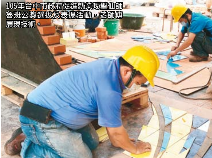
105年台中市政府促進就業巧聖仙師魯班公獎選拔及表揚活動，老師傅展現技術。

的新選手說，實作經驗不足，抹水泥不聽使喚，看老師傅談笑間就可抹好一大片，「真的好強」！