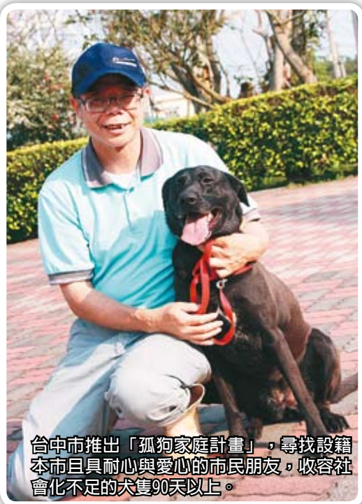
台中市推出「孤狗家庭計畫」，尋找設籍本市且具耐心與愛心的市民朋友，收容社會化不足的犬隻90天以上。