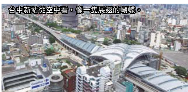
台中新站從空中看，像一隻展翅的蝴蝶。

蔡英文總統參觀台中新站表示，在大家心裡，車站就是家鄉，城市記憶和台中歷史文化的厚度，在城市規劃中共同打造出文化城，新的城市發展正要開始，她說原來的台中火車站已創下一百年歷史，新的台中車站將替未來打下另一個百年基礎。