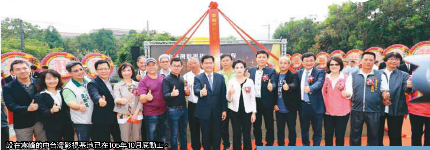
設在霧峰的中台灣影視基地已在105年10月底動工。

中台灣最具規模、全台唯一能拍水景的「中台灣影視基地」，在10月底正式動工了，預定107年就會完工。未來不僅是影視拍攝製作的重要基地，還能提供給各大專院校做為產學合作，培植台灣的影視技術人才場所，也能帶動霧峰區整體經濟發展。