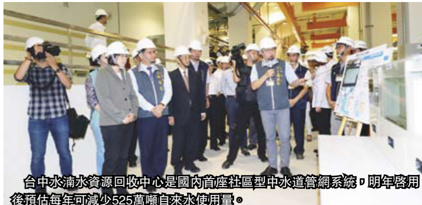
台中水滴水資源回收中心是國內首座社區型中水道管網系統，明年啓用後預估每年可減少525萬噸自來水使用量。

台中水滴水資源回收中心是國內首座社區型中水道管網系統，明年啓用後預估每年可減少525萬噸自來水使用量，節省約5,000萬元自來水費用。10月中旬，總統蔡英文在台中市市長林佳龍陪同下前往視察，林市長表示，總統視察後很重視，認為可推動到其他縣市。