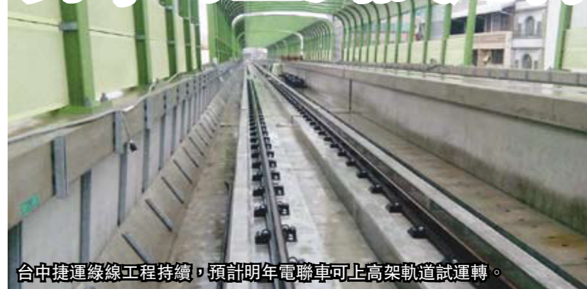
台中捷運綠線工程持續，預計明年電聯車可上高架軌道試運轉。

台中捷運綠線全長16.71公里，採鋼軌鋼輪系統，北屯機廠鋼軌鋪設已完成，配合機電標設備安裝後，即可迎接首列電聯車整備測試；主線段正進行混凝土基座及鋼軌鋪設，預計明年就能看見電聯車於高架軌道上進行測試運轉。