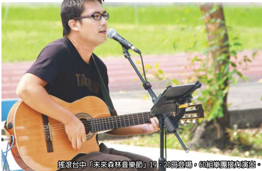
搖滾台中「未來森林音樂節」19、20日登場，60組樂團接力演出。

邁入第9年的「搖滾台中」，今年擴大規模與流行音樂界合作，11月19、20日壓軸活動「未來森林音樂節」登場，在帝國糖廠（台糖）湖濱生態園區與東區樂業國小，60組樂團在四大舞台接力開唱。