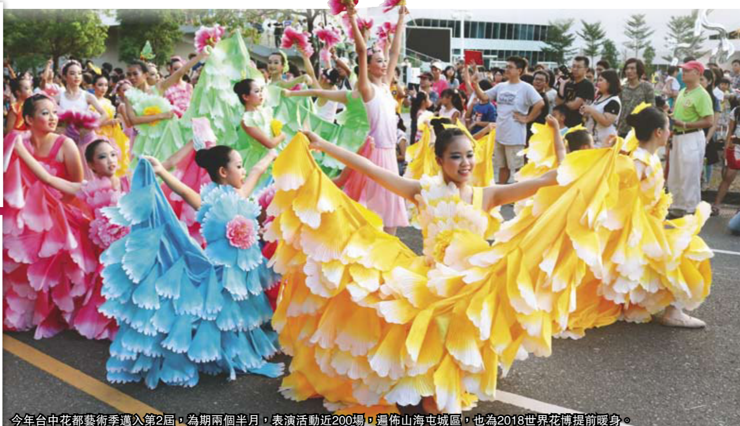
今年台中花都藝術季邁入第2屆，為期兩個半月，表演活動近200場，遍佈山海屯城區，也為2018世界花博提前暖身。