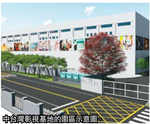
中台灣影視基地的園區示意圖。

中台灣最具規模、全台唯一能拍水景的「中台灣影視基地」，在10月底正式動工了，預定107年就會完工。未來不僅是影視拍攝製作的重要基地，還能提供給各大專院校做為產學合作，培植台灣的影視技術人才場所，也能帶動霧峰區整體經濟發展。