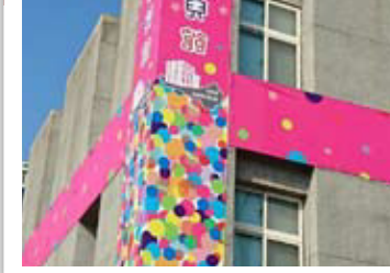
台中市打造「臺中女兒館」，這是亞洲第一座專屬女孩們的空間，以女孩們為主體的設計，幫助女孩實現計畫與夢想。