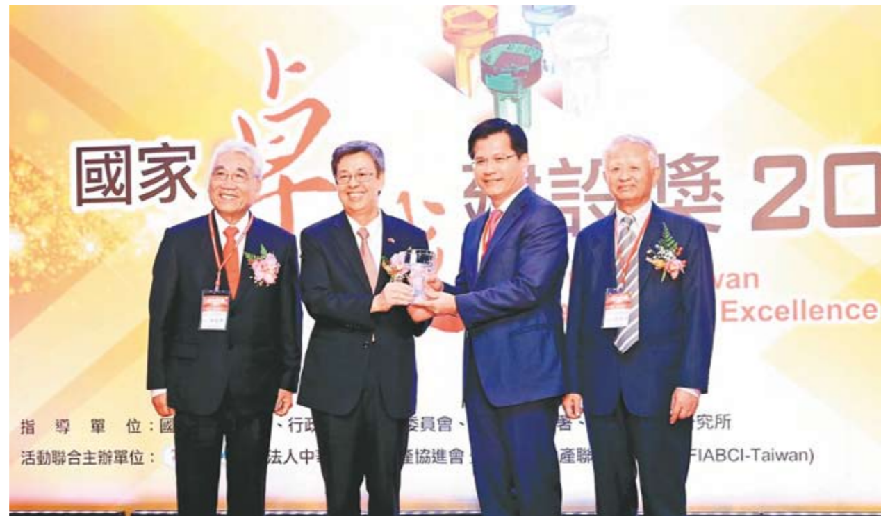
台中市長林佳龍(右二)獲得國家卓越建設獎國土特別貢獻獎，由副總統陳建仁(左二)親自頒獎。

獲得金質獎有「北區圖書館興建工程」、「朝馬國民運動中心」、「中正國民運動中心」、「鰲峰山公園整體發展建設工程」、「忠信國小美學步道」；還有優質獎2座，包含建設局的「海洋生態館新建工程」、「水湳40M-11號道路與中科東向道路銜接工程」。