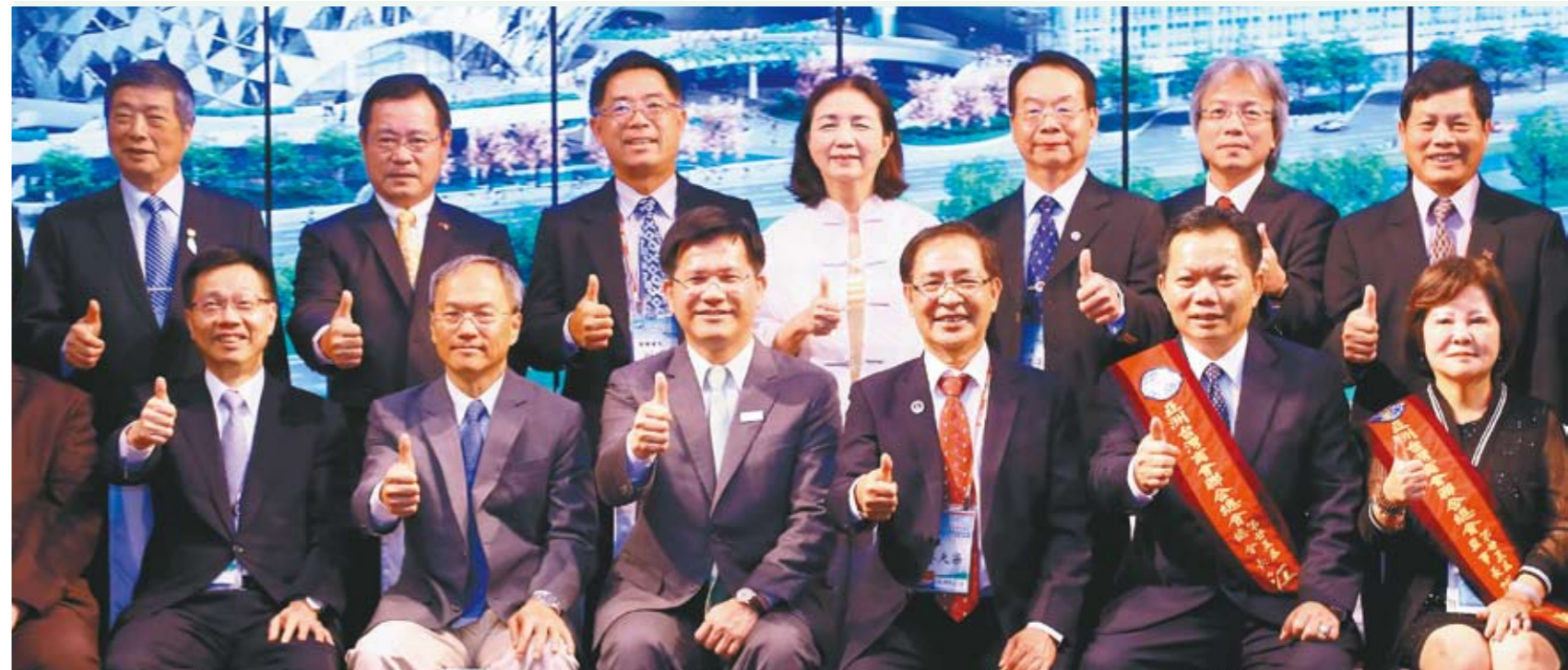
亞洲台灣商業聯合總會年會今年在台中舉行，見證中台灣崛起。