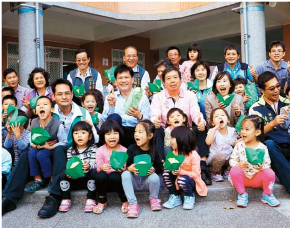
台中市人口超越高雄市，成為全台人口第二大城；市府分析產業前景看好，加上托育、社福誘因多，吸引人口移入。