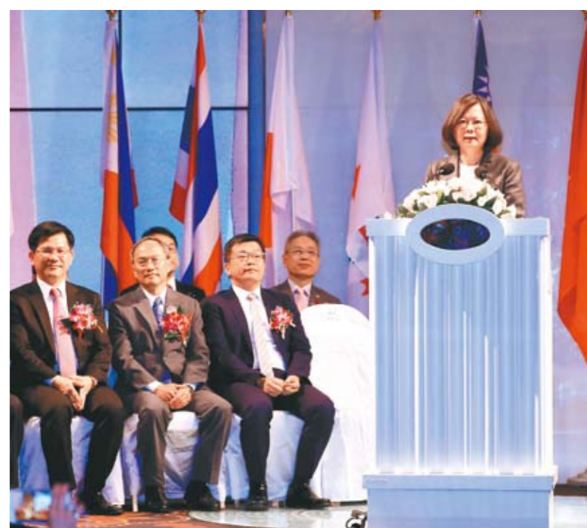
總統蔡英文參加亞洲台商聯合總會年會，向台商推薦中台灣的特有產業優勢，宣告中部正在崛起中。

明年台中市將舉辦世界花卉博覽會，市府透過花博打造花園城市，花博結束後，展覽場館將沿用保留，他邀請企業共同加入花博行銷行列。