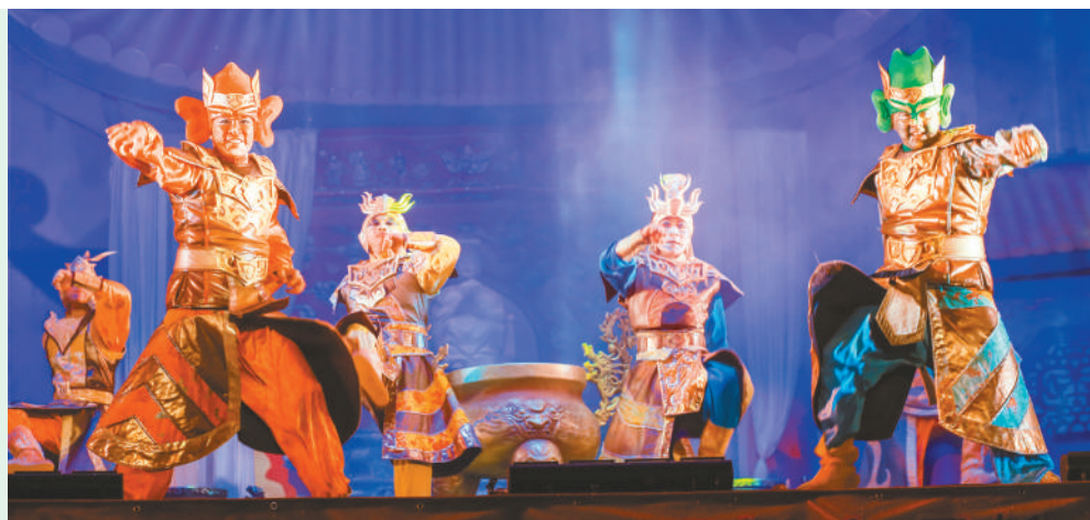
↑ 台中媽祖會「媽祖戲劇之夜」, 紙風車劇團演出《順風耳的新香爐》。