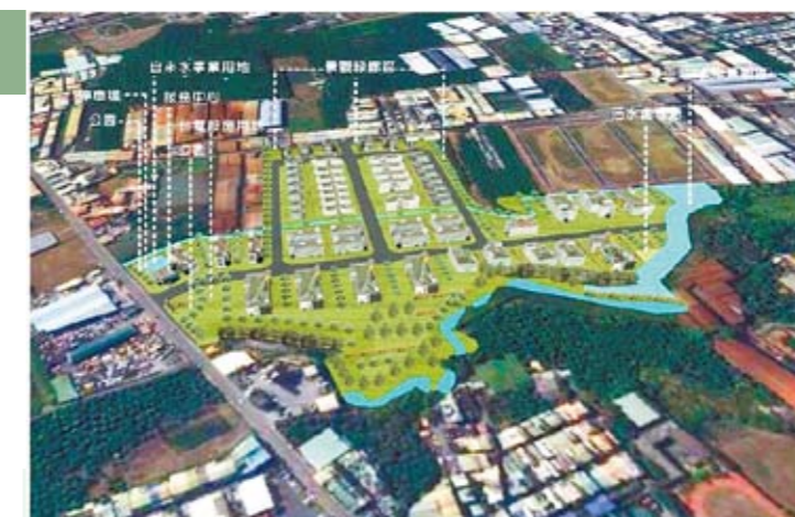
太平產業園區動土，預計明年完工。

另也提出台中市區域計畫，規劃在大里夏田里、神岡及塗城等3地，以新訂或擴大都市計畫方式，在環保與產業發展中取得平