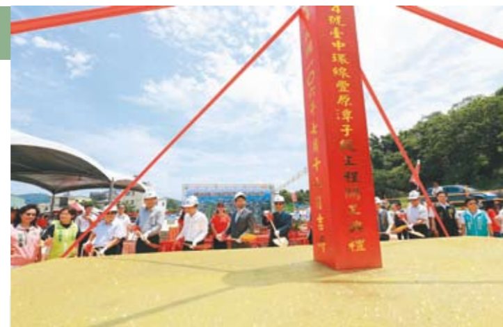
台中市長林佳龍參與國道4號台中環線豐潭潭子段工程開工動土儀式。

台中市長林佳龍說，未來來往台中市區或山海屯區，均可利用高速或快速道路直接串聯，無須進出城區的交流道通行，可有效紓解目前車流在上下中山高速公路交流道時的塞車情形，進一步實現大