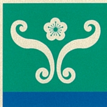
國立自然科學博物館 館長 孫維新