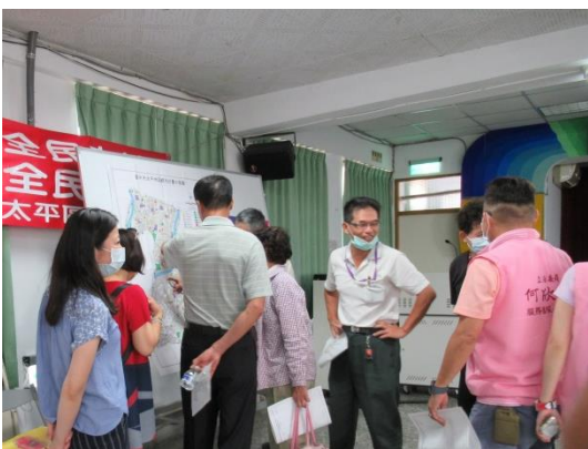
民眾閱覽相關資料