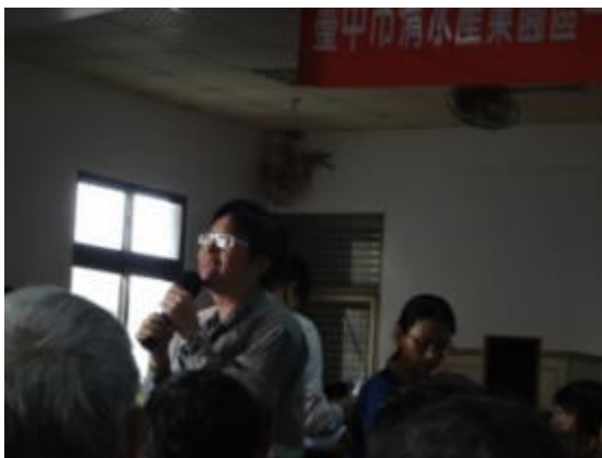
開發單位及民眾意見溝通與討論