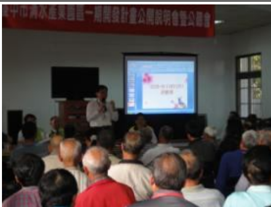
開發單位及民眾意見溝通與討論