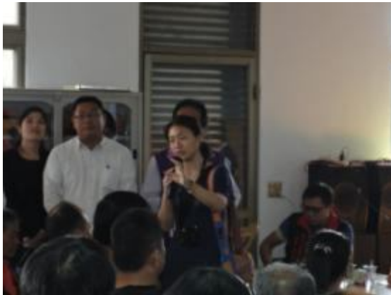
開發單位及民眾意見溝通與討論