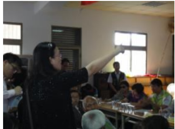
開發單位及民眾意見溝通與討論