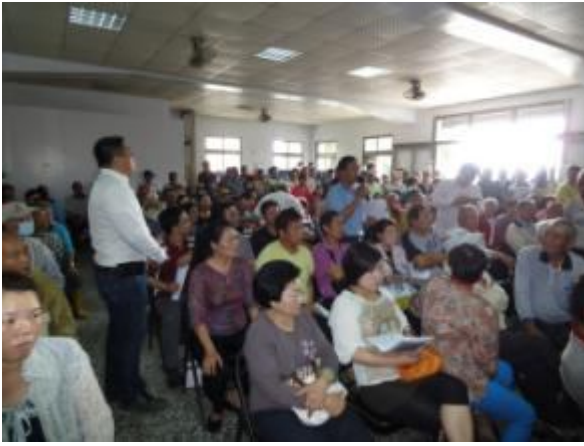
開發單位及民眾意見溝通與討論