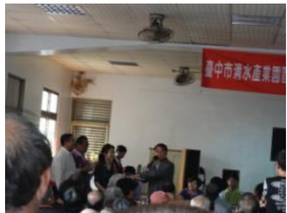
開發單位及民眾意見溝通與討論