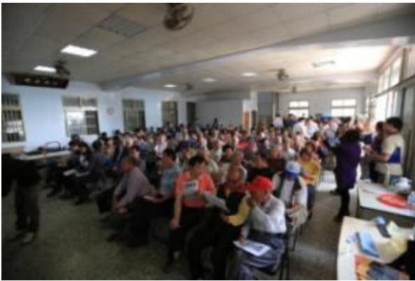
參與民眾及會場現況