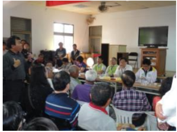
開發單位及民眾意見溝通與討論