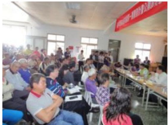
開發單位及民眾意見溝通與討論