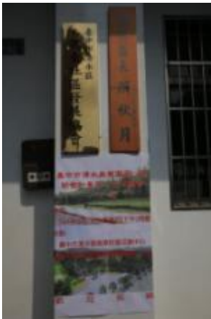
會場現場-公告張貼