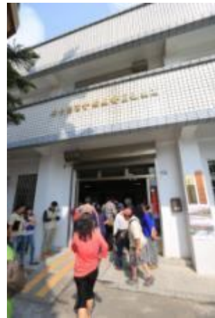
參與民眾前往會場