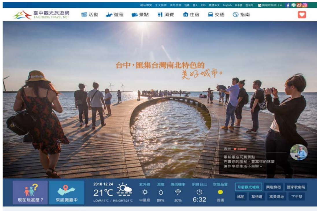
圖 6.臺中觀光旅遊網優化改版示意

臺中觀光旅遊網配合網路瀏覽者習慣及喜好持續更新、優化，以當季主題露出旅遊推薦，導入社交軟體 FB 及 IG 文章資訊露出，另外首頁導入即時天氣、空氣品質、紫外線、災害預警提醒等資訊，提供 LBS 適地化服務，給予遊客位置最即時週邊旅遊訊息，讓遊客能接收第一手資訊。110 年度網站預計瀏覽成長量突破 1,000 萬人次。