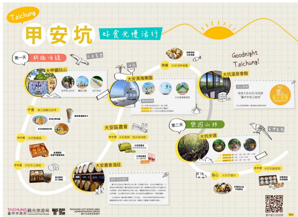
圖 2. 甲安坑主題魅力遊程