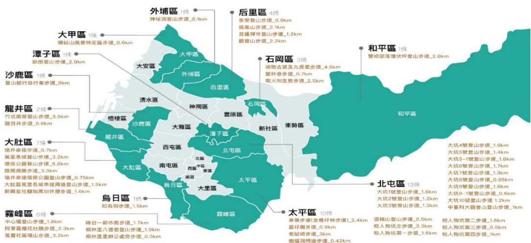
圖 4.臺中市政府觀光旅遊局權管登山步道總表

TAICHUNG 觀光旅遊局 臺中市政府 Tourism and Travel Bureau