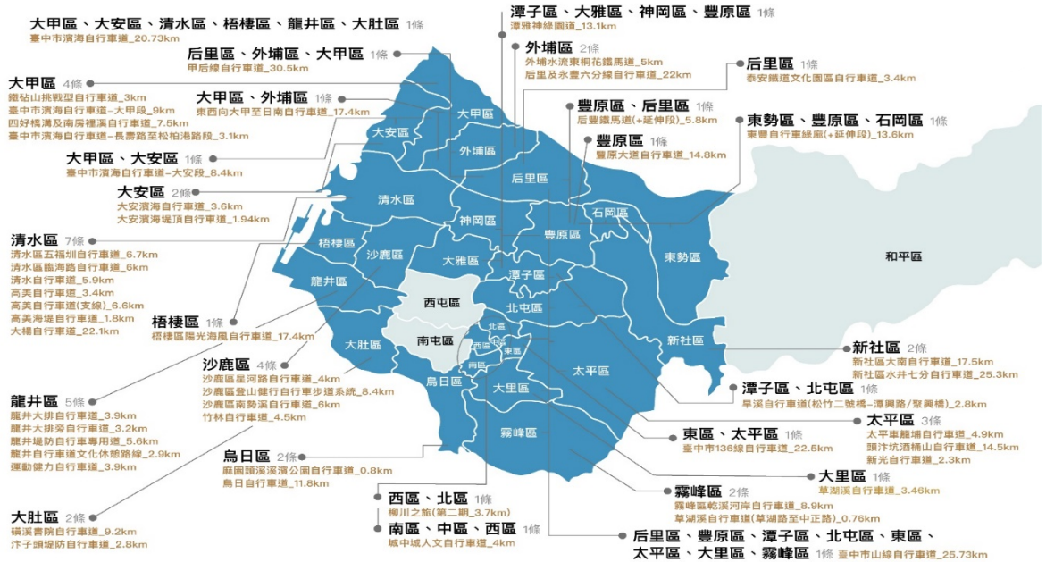
圖 3.臺中市政府觀光旅遊局權管自行車道總表

TAICHUNG 觀光旅遊局 臺中市政府 Tourism and Travel Bureau