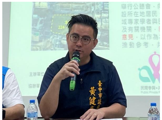
民意代表（黃健豪議員）