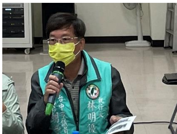
民意代表（曾朝榮議員服務處）