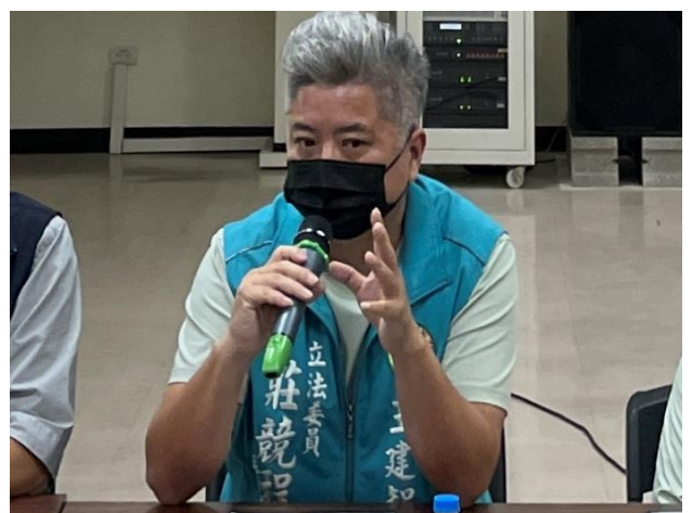
民意代表（莊敬程立委服務處）