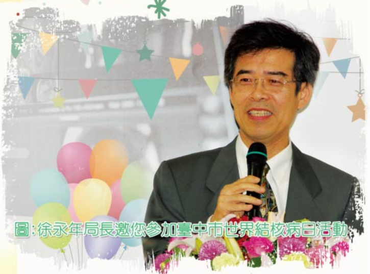
圖：徐永年局長邀您參加臺中市世界結核病日活動

由結核菌所引起的結核病俗稱肺癆，是一種慢性傳染病，不會遺傳，主要是侵襲肺部，透過飛沫與空氣傳染，親密接觸的家人很容易被傳染，早期常見症狀為咳嗽（特別是2週以上）、發燒、食慾不振、體重減輕、倦怠、夜間盜汗、胸痛等症狀，症狀往往不明顯或特異性，容易被忽略而延誤治療，因病情進展緩慢，不治療的話會愈來愈嚴重。